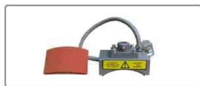
* CAP INTERCHANGEABLE PLATE

Sin necesidad de aire comprimido. Funcionamiento electromagnético.