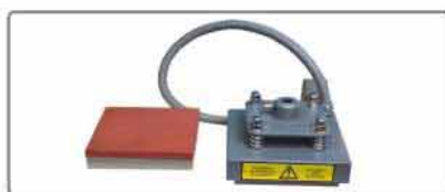
* 15 x 15 CM INTERCHANGEABLE PLATE