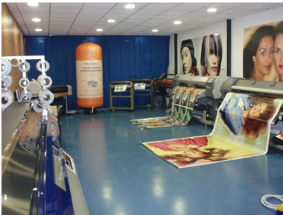
Sala demo de Badalona

Este es el secreto de Tecnohard, trabajar en equipo con sus clientes, poniendo a disposición, sus salas demo, y su servicio de reparación que cuenta con los recambios necesarios para toda la maquinaria que comercializa. También ofrece , Open doors y jornadas de formación.