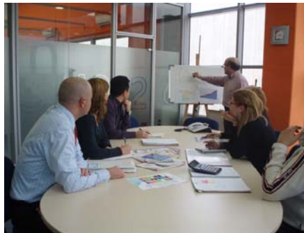
El equipo comercial y marketing de Tecnohard, asesora a partir de la información del cliente de la mejor alternativa

Por eso Tecnohard pone a disposición de sus clientes un amplio equipo técnico, del cual un porcentaje elevado son ingenieros especialistas en impresión digital, formados por Mutoh y en gestión de color, para la asistencia, formación técnica, reparaciones instalaciones y curvas de color. En definitiva un servicio técnico a la carta.