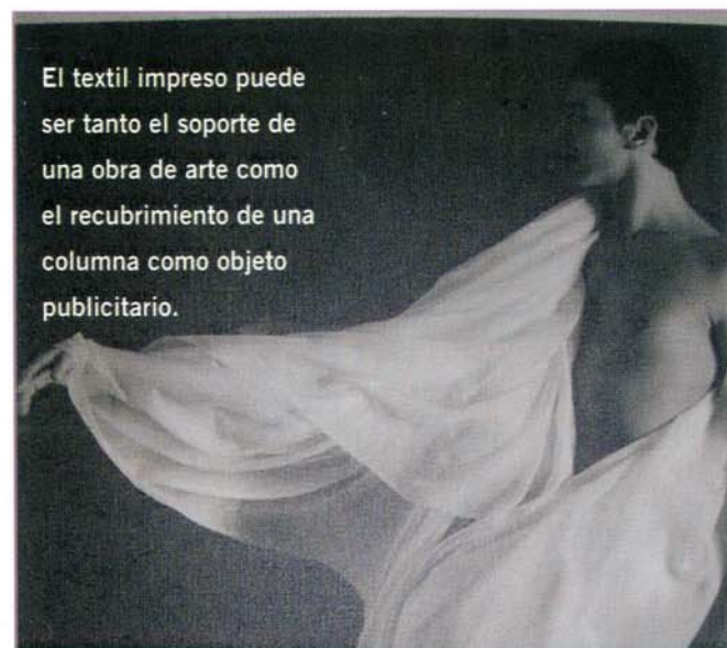
El textil impreso puede ser tanto el soporte de una obra de arte como el recubrimiento de una columna como objeto publicitario.

La combinación de los materiales exclusivos de Tecnohard con la tecnología de impresión digital base solvente hacen realidad los sueños de muchos talleres de confección que requieren productos tanto para interior o exterior, o incluso para serígrafos u otros mercados.