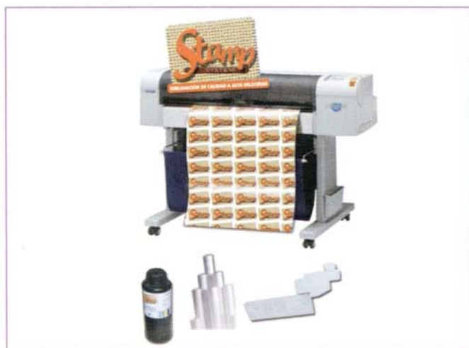
Stamp System proporciona una gran calidad de imagen a alta velocidad.

Con estos equipos de sublimación se consiguen plasmar diseños a todo color sobre un gran abanico de materiales, no sólo textiles, con total calidad, añadiendo así, un mundo nuevo de posibilidades para ampliar negocios. La avanzada tecnología de los equipos y materiales de Tecnohard, posibilita una producción personalizada, sin renunciar a los más altos estándares de calidad. Es el caso de soluciones como Stamp System de Tecnohard.